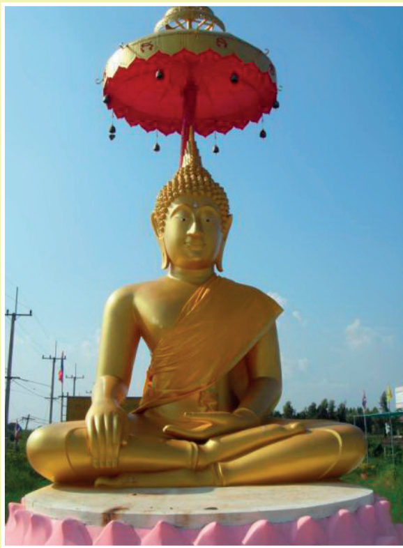
หลวงพ่อกันใจ ณ อุทยานโพธิสัตว์ธรรม