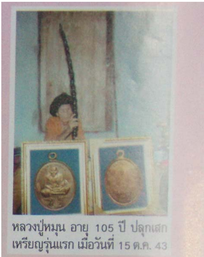
หลวงปู่หมุน อายุ 105 ปี ปลุกเสก เหรียญรุ่นแรก เมื่อวันที่ 15 ต.ค. 43

มวลสาร ก็เป็นเนื้อโลหะธรรมดาโรงงานนี้แหละครับแต่ด้วยอำนาจบารมีของ หลวงปู่หมุนสามารถทำให้โลหะธรรมดาทั่วไปกลายเป็นสิ่งศักดิ์สิทธิ์ด้วยการ เติมน้ำตุนุณาตุนุ เหรียญเนื้อทองแดงไปทำสามกษัตริย์ น่าจะไม่เกิน 300 เหรียญ เพื่อเพิ่มมูลค่าและความสวยงาม