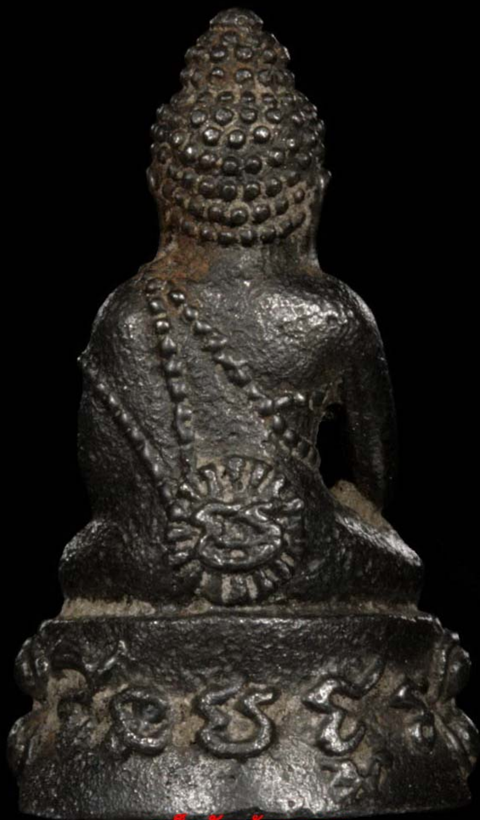
เด็กวัดบ้านจาน