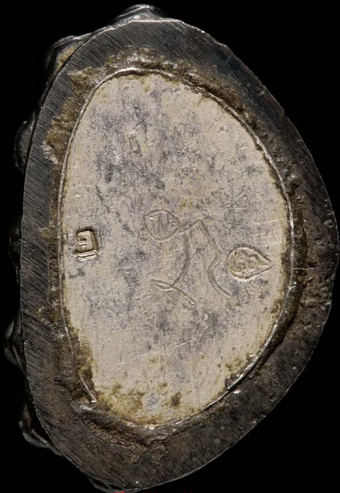
เด็กวัดบ้านจาน