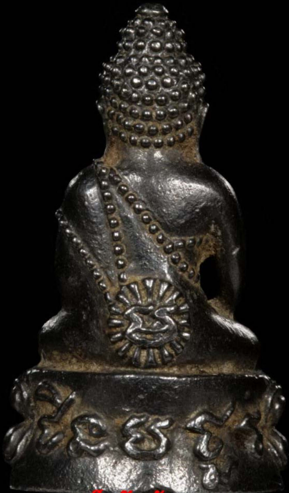
เด็กวัดบ้านจาน