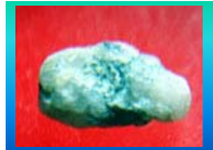
พระธาตุที่แปรสภาพจากอัญจิ