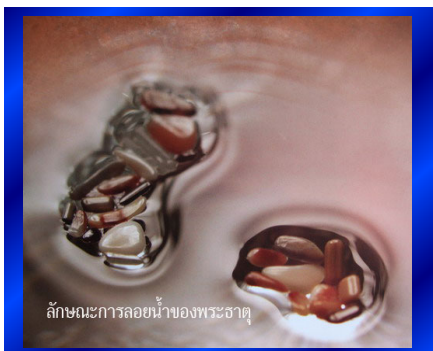
ลักษณะการลอยน้ำของพระธาตุ

ตามโบราณจารย์ต่างๆท่านกล่าวว่า พระบรมสารีริกธาตุและพระธาตุที่มีขนาดไม่ใหญ่นัก สามารถที่จะ ลอยน้ำได้ ส่วนการลอยน้ำของพระบรมสารีริกธาตุและพระธาตุนั้น จะลอยน้ำโดยที่น้ำจะเป็นแอ่งบุ๋มลงไปรองรับ พระบรมสารีริกธาตุไว้ นอกจากนี้อาจปรากฏรัศมีของน้ำรอบๆ พระบรมสารีริกธาตุอีกด้วย ทั้งนี้หากทำการลอย พร้อมๆกันหลายๆองค์ พระบรมสารีริกธาตุจะค่อยๆลอยเข้าหากันและติดกันที่สุดในที่สุด ไม่ว่าจะลอยห่างกันสักเพียงใด หากมีพระบรมสารีริกธาตุประดิษฐานอยู่ ณ ที่ใดแล้ว หากมีการถวายความเคารพเป็นอย่างดีและเหมาะสมแล้ว ท่านก็สามารถที่จะดึงดูดองค์อื่นๆให้เสด็จมาประทับรวมกันได้